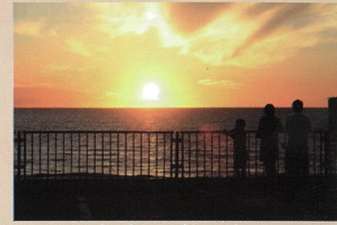
日本海に沈む夕日